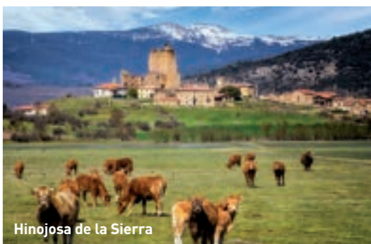
Hinojosa de la Sierra

Hinojosa de la Sierra Con pasado de villa perteneciente al señorío de los Mendoza, conserva los restos de su castillo del siglo XV y un palacio renacentista con galería porticada declarado Monumento Nacional. Su valor ecológico reside en una laguna estacional y la Laguna de la Serna , un punto de observación de avifauna migratoria. Su Iglesia Ntra. Sra. de la Asunción posee portada románica y un retablo del siglo XVII .