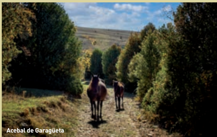
Acebal de Garagüeta

Cada otoño, la naturaleza ofrece un espectáculo impresionante: la berrea del ciervo. En esta época, los machos se enfrentan en majestuosas competiciones por conquistar a las hembras, llenando el bosque con sus potentes bramidos. La Sierra de Cebollera, con su abundante vegetación y sus claros naturales, es el escenario ideal para presenciar este fascinante momento, especialmente al amanecer o al atardecer.