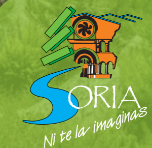
Laguna de Cebollera