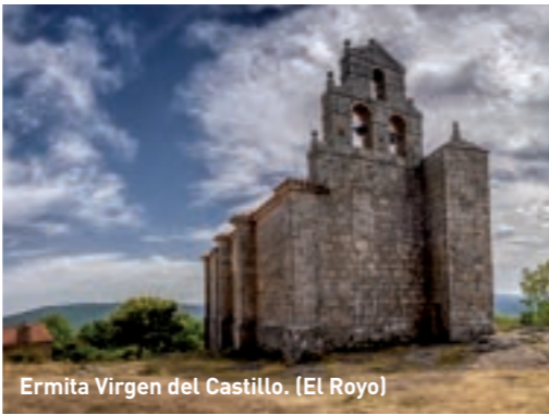
Ermita Virgen del Castillo. (El Royo)

Villar de Ala Visita la Iglesia de San Salvador, la Ermita de San Martín (también en el despoblado de Aza) y las Ruinas de la Casa del Molino. El cementerio conserva