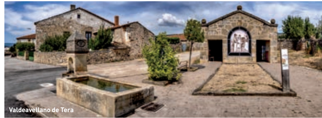
Valdeavellano de Tera

Rebollar > Rollamienta > Valdeavellano de Tera > Molinos de Razón > Sotillo del Rincón > Aldehuela del Rincón > Villar de Ala > El Royo