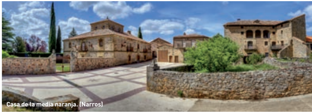
Casa de la media naranja. (Narros)

Garray > Renieblas > Almajano > Narros > Aldeaseñor > Carrascosa de la Sierra > Castilfrío de la Sierra