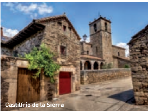
Castilfrío de la Sierra

de miliario romano. Alberga importantes yacimientos arqueológicos , destacando los cinco campamentos romanos republicanos en el cerro «La Gran Atalaya», algunos relacionados con las guerras numantinas. También encontrarás las ruinas del palacio de los Luzones y tres relojes de sol en piedra.