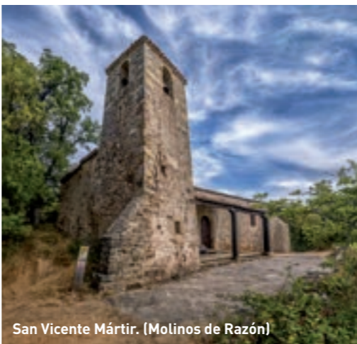
San Vicente Mártir. (Molinos de Razón)

El Royo A 24 km de la capital, cuenta con vestigios desde el neolítico y restos de un castro de la Edad del Hierro. La Ermita de la Virgen del Castillo , de estilo gótico tardío, se construyó en un alto para que pudiera ser divisada y sus campanas se oyeran por los pastores de la comarca. La Iglesia de Ntra. Sra. de la Esperanza (s. XVIII) destaca por un reloj de sol en la torre. Explora El Chorrón , una curiosa formación geológica y zona de baño natural, y el área de descanso Kilómetro 17, ambos en la sierra Cebollera. Observa las llamadas casas de indianos , construcciones influenciadas por la arquitectura del Nuevo Continente. Desde lo alto de la torre de la ermita, se pueden contemplar unas vistas únicas al Embalse de la Cuerda del Pozo.