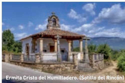
Ermita Cristo del Humilladero. (Sotillo del Rincón)

Sotillo del Rincón Aquí se recuperó el lavadero y un puente de madera que une con Molinos de Razón. Sus templos religiosos son la Iglesia de la Natividad de Nuestra Señora y la Ermita del Cristo del Humilladero. Disfruta de la piscina natural en el río Razón, con 100 metros y praderas en las orillas para reposar.